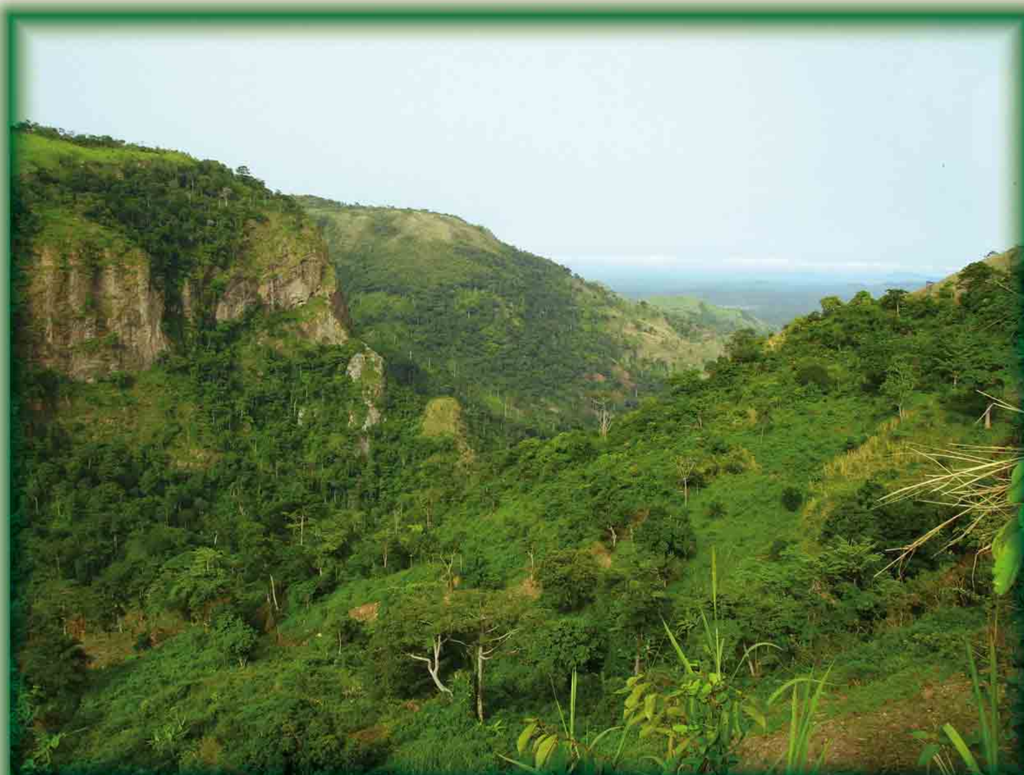
Panorama depuis le site Kpetsovi

Remontez ensuite le cours d'eau dans un cadre magnifique pour découvrir la grotte et la cascade de Siatifu.